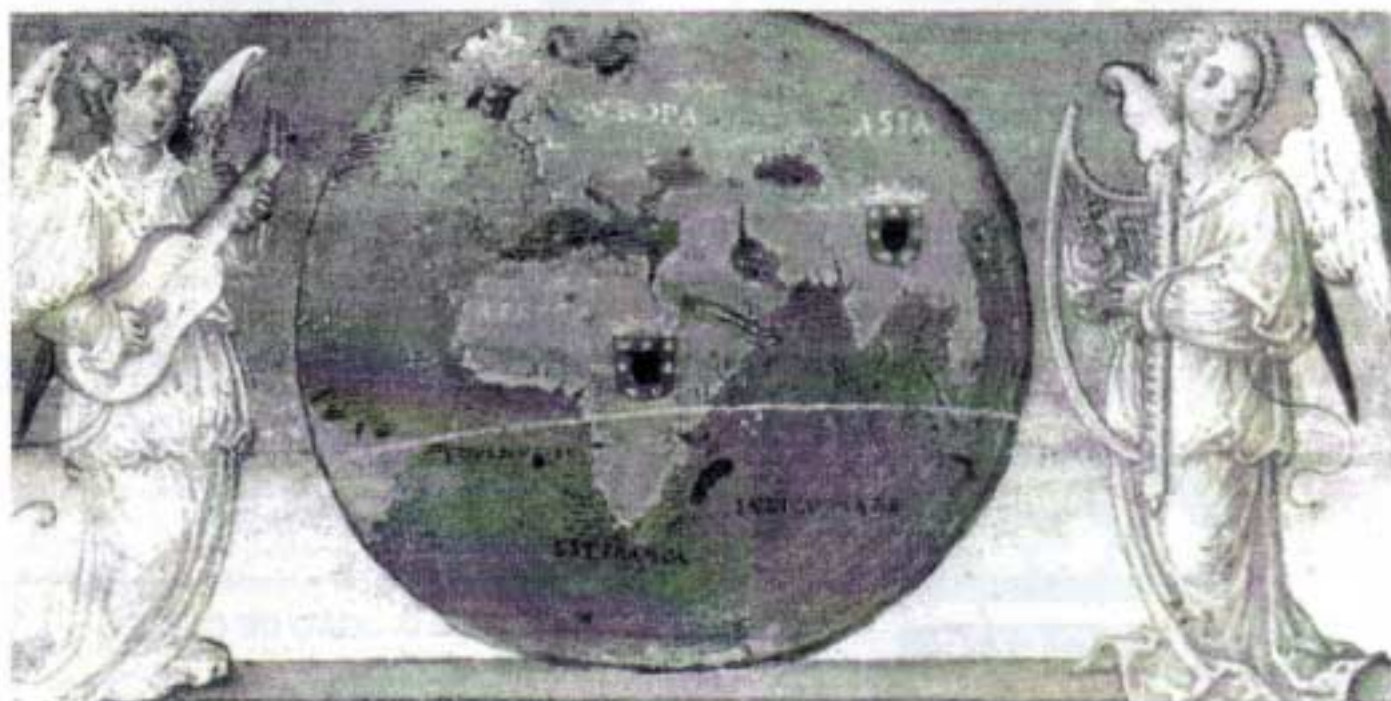
Tratado de Tordesilhas. Marcação do ponto Oeste no Brasil.

Esperamos que o XI sirva para despertar o entusiasmo dos estudantes pelas realidades da Lusofonia como universo cultural, e suscite uma melhor compreensão dos aspectos