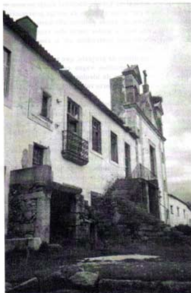
Ruínas da Casa de Aldeia da Ponte (1998), 1.º Colégio Claretiano em Portugal

Celebramos pois, os Claretianos, os 150 anos da fundação da nossa Congregação. Nestes 150 anos os Claretianos espalharam-se pelos 5 continentes do mundo.