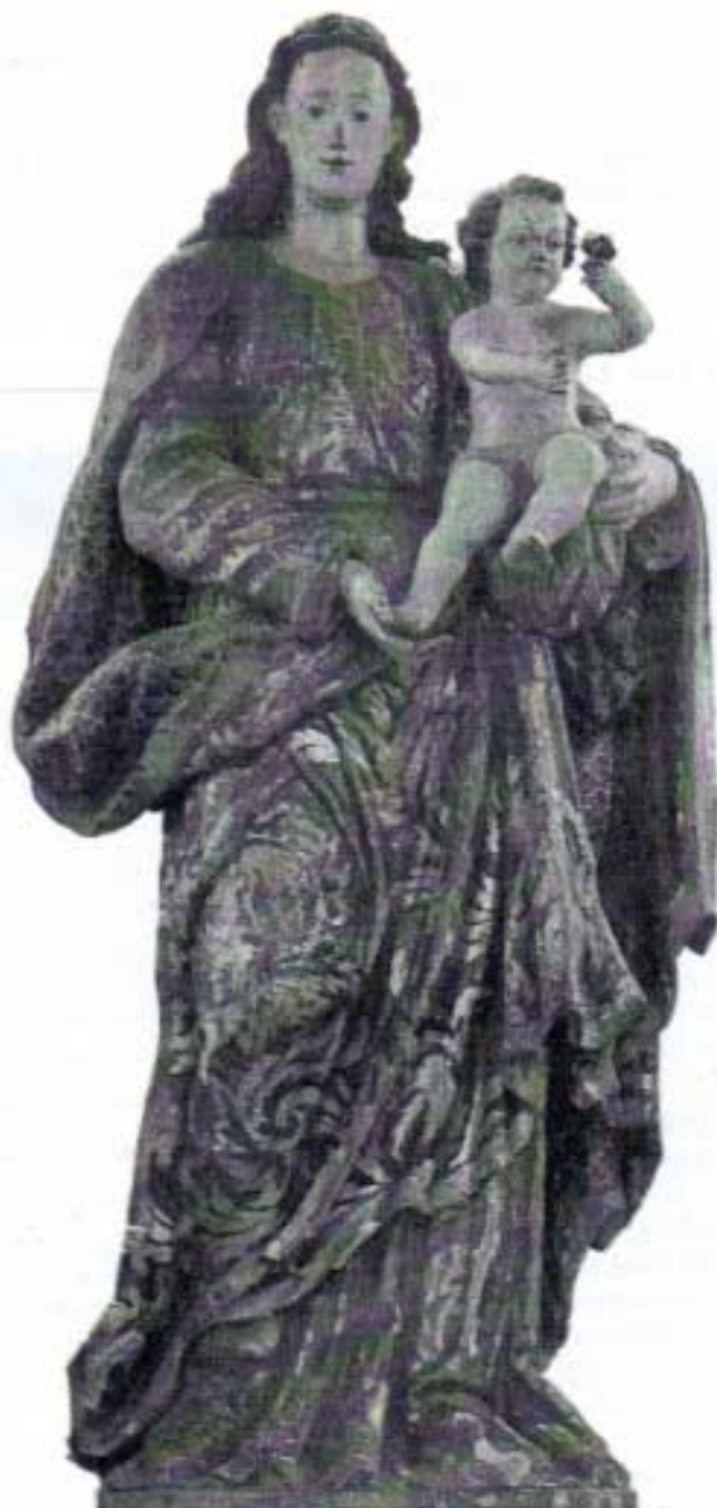
Imagem de Nossa Senhora do Século XVIII Catedral de Lisboa