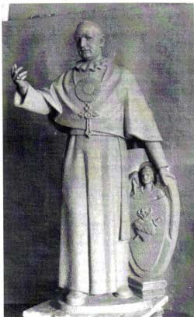
Estátua em mármore na Basílica de Fátima

A partir de 1918 as Congregações Religiosas recomeçam a implantar-se em Portugal e posteriormente no Ultramar, sendo