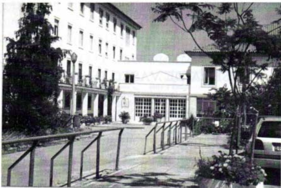
Colégio universitário Pio XII na cidade Universitária de Lisboa

oriundos de todo o país e Regiões Insulares e trabalhando na imprensa, noutros meios de comunicação social e dirigindo instituições culturais do mais alto nível nacional e europeu.